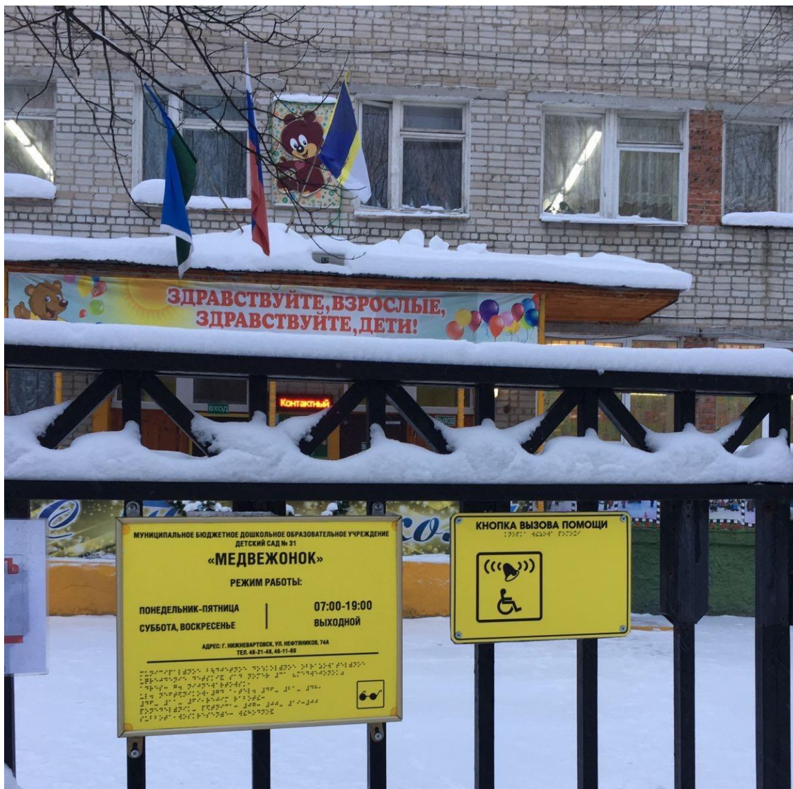
Кнопка вызова помощи

тактильные таблички с надписями шрифтом Брайля